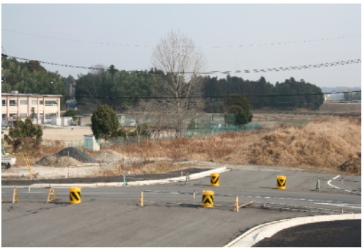
整備を待つ中部小運動場拡張用地

文字ばかりで申し訳ありません。書きたいこと、伝えたいことがいっぱいあって・・・！