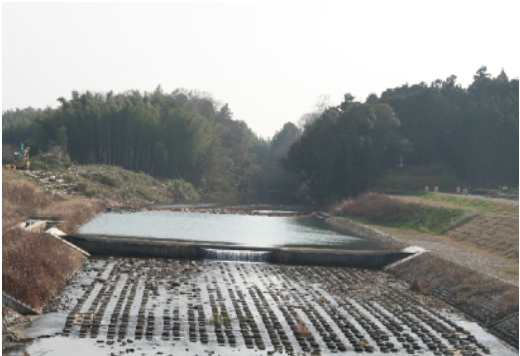
整備の急がれる杣川河川改修