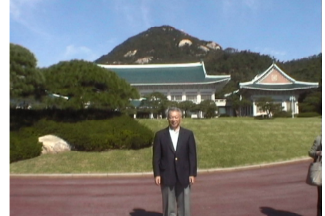
四月に入学した放送大学大学院天川ゼミ(地方自治)で韓国を訪問。青瓦台(大統領府)にて

高度情報化の進展にはめざましいものがあり、ハード面もソフト面でも日々変化していると言っても過言ではありません。甲賀市にどのような情報網を巡らすのか、情報格差を生まないようにする方策は、高齢者への対応や緊急時の対応等々、課題は山積です。引き続きの担当、励みます！